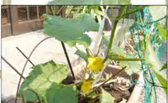
花も咲き始め、実をつける時が楽しみです。