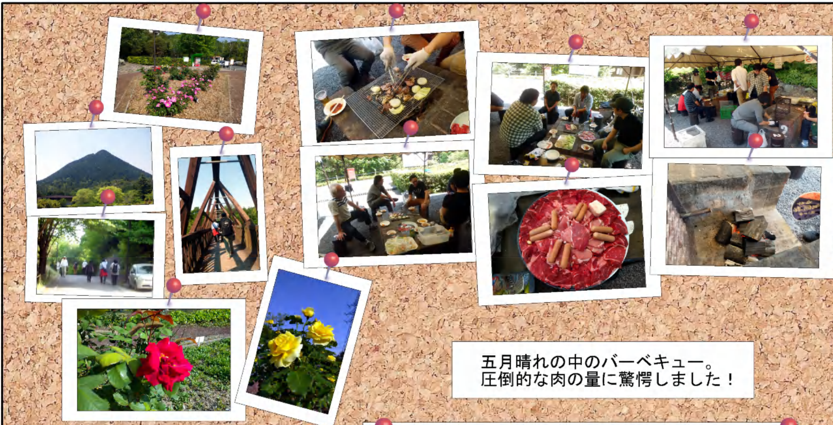
五月晴れの中のバーベキュー。 圧倒的な肉の量に驚愕しました！