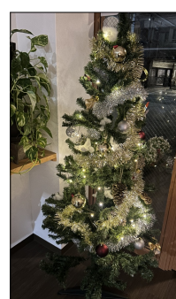
玄関をきれいに彩ってます。