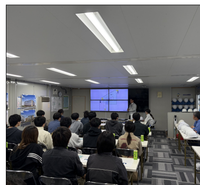
設計概要説明の様子

今回現場を見学された学生は3回生ということで、今後の就職活動を行っていく上で今回の現場見学会が少しでも参考になれば光栄に思います。