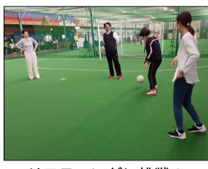
リフティングに挑戦!