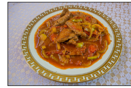
伝統料理カムマック