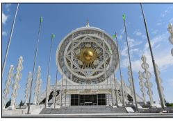
アレム中央文化センター