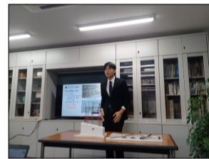
ALCサンプルを用いて説明していただきました。