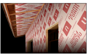
断熱材(ネオマフォーム)