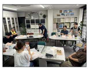
所員揃っていただきました。

9月7日、おかげさまで弊社は創立58年目を迎えました。毎年、記念に赤飯弁当をいただきお祝いしています。今年も記念日当日が休業日だったため、土曜研修の昼食に所員全員で美味しくいただきました。今年もこの日を迎えることができ、関わる全ての皆様に感謝申し上げます。また改めて初心に戻り、精進を積み重ねて参ります。