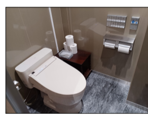
改修済の男子トイレ