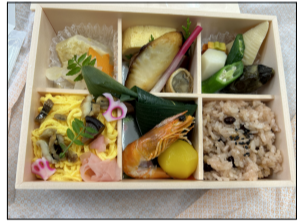
栄養バランス、彩りも良く美味でした。