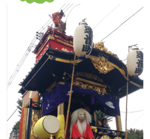
囃子台の上で舞う囃子連

「はじめに」 今年の研修旅行は、埼玉県川越市と春日部市へ一泊二日の日程で出かけました。一日目は、川越祭り と川越伝統的建造物群保存地区を見学しました。 二日目は、春日部市の首都圏外郭放水路を見学しま した。全体的には小雨模様でしたが、天候にも恵ま れ、充実した研修旅行となりました。 「川越伝統的建造物群保存地区 見学」 江戸時代からの歴史ある町家は、明治26年の川越 大火に遭いました。復興にあたり、商人が防火性能の 高い土蔵造りを取り入れ、重厚な蔵造り町家の立ち並 ぶ町並みが形成されたと言われています。 大正以降近代洋風建築や洋風外観の町家等 もあり、各時代の特色が反映された伝統的 建造物群でした。