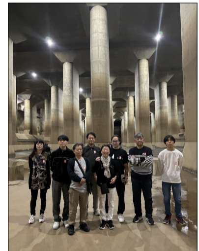
地下神殿で集合写真!