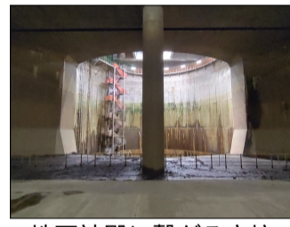
地下神殿に繋がる立坑