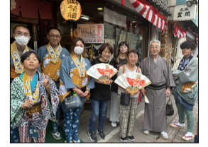
地元の方と記念写真