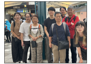
川越市で集合写真

「川越祭り」 川越市の歴史ある川越まつり真つ只中でした。山 車の前部には囃子台があり、その上では囃子連によ る舞が披露され、祭りの活気を肌で感じられました。