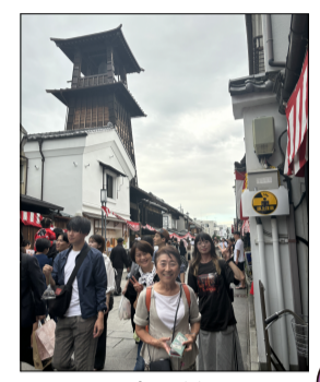
時の鐘 (指定有形文化財)