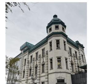
旧八十五銀行本店本館 (国の登録有形文化財)

「川越祭り」 川越市の歴史ある川越まつり真つ只中でした。山 車の前部には囃子台があり、その上では囃子連によ る舞が披露され、祭りの活気を肌で感じられました。