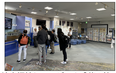
地底探検ミュージアム「龍Q館」