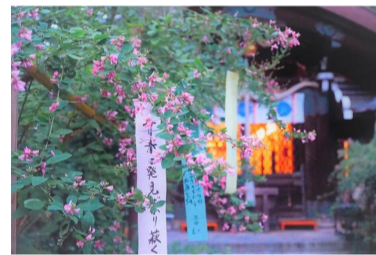
萩まつり イメージ

萩まつりが行われ、舞や弓術を奉納しています。今年は9月21日に開催予定ということで、秋を楽しんでみてはいかがでしょうか？