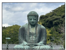
10月：研修旅行 鎌倉・横浜