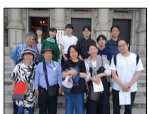
5月：北浜レトロ建築巡り

今月をもって、56期が終了します。初めて所外の方を招いた企画やZEBの勉強会等新たな企画にチャレンジした1年となりました。