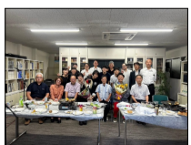
7月：ゲストを招いて講演会・BBQ