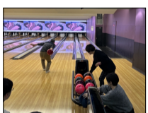
1月：ボウリング大会