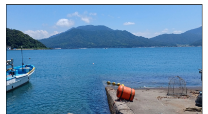
実家の前の海よく晴れていて綺麗でした。