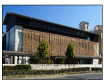
4月：龍谷ミュージアム見学