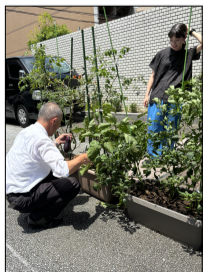
収穫のご協力をお願いします!