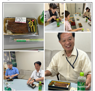
揃っていただきます!

今年の「土用の丑の日」は7月24日です。当社の所長企画として、今回も所員全員が揃って7月22日に所長より、うな重をふるまっていたいただきました。タンパク質やミネラルが豊富で、厳しい京都の夏を乗り切るのにぴったりです。美味しいうなぎをごちそうになりました。