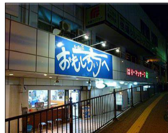
お店の入口は風情があって味のある外観でした