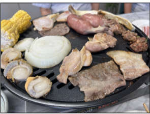
上手に焼けました