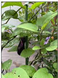
ぶくぶく実ったナス!

4月に苗を植え、育て始めた野菜は7月に入ると最盛期を迎え、1週間に1度は収穫し、もぎたてを食べたり、おかずにしたりしました。少しずつ成長する食物を観察していると、忙しい日常の中の癒しや、自然の恵みを感じることができ、無事に育ってくれて嬉しいです。 土曜研修のBBQで、大きく育ったナスやしし唐、トマトも収穫し、参加いただいたみなさまにも、もぎたてを召し上がっていただきました。