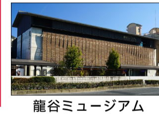
龍谷ミュージアム

午後は龍谷ミュージアムへ現在開催中の「バーミヤン大仏の太陽神と弥勒信仰」を見学しました。歴史ある仏像など普段目にしないものを見ることができ、同じ信仰でも地域時代での違いを知ることができました。