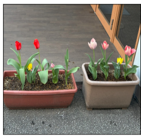
きれいに咲きました！

早くも4月。本格的に暖かくなり、チューリップが急速に成長しました。ついに赤、白、ピンク、黄色の花が咲き、玄関先で春を感じられました！