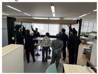
快適な空気環境をつくる「エアソリューション」

LED照明の採用、照度を抑え、AI搭載の空調設備を試用運転するなど、非常に高度で多彩な技術を実現されていました。その実物や空間を間近で見て当社の事務所設備機器の違いを実感するとともにZEBの視点から建物の環境を見つめ直す良い機会となりました。