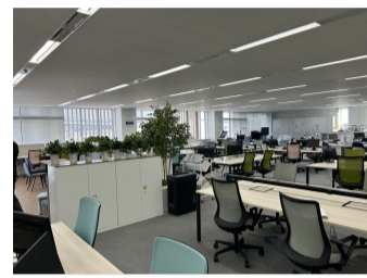
パナソニック京都ビルオフィスの様子