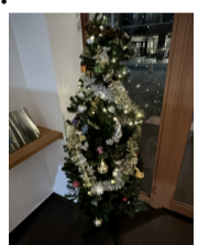
きれいに飾り付け出来ました!

毎年恒例のクリスマスツリーを飾り付けました。ツリーを見ると一気に年末モードとなります。今年も残りも全力で頑張ります!