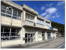
現在の上宮津小学校 外観(昇降口)

「上宮津地区公民館改修設計業務」 私の地元である京都府宮津市で廃校になった小学校を公民館に整備する改修設計業務です。小学校の雰囲気を活かしながら、外観や玄関回り等は公民館として新たな顔になるようにデザインしました。内装には丹後ちりめんや府内産木材を使い、地元を親しみを持ってもらえればと思い設計に取り組みました。