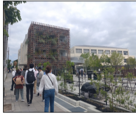
5月土曜研修で見学した「NATURE STUDIO」

先月、土曜研修で見学した「NATURE STUDIO」について、所員でディスカッションを行いました。今回の建物見学は公募型プロポーザルにて選定された施設で設計業務に繋がる部分もあり様々な視点の意見が飛び交い有意義な時間となりました。