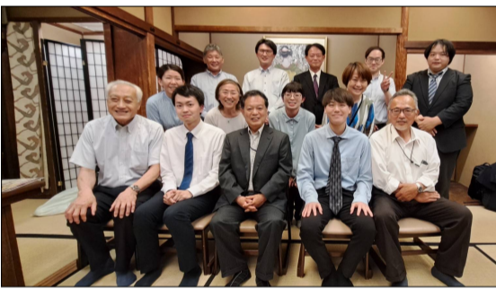
~ にこやかに記念撮影 ~

八月で七十五歳になります。事務所に着職して半世紀以上です。小学校の卒業文集に『将来は建築家になる。』と書いたように、あこがれの職業でした。若いときは時間を忘れて、仕事ばかりしていました。高度成長期で右肩上がり、たくさんいい経験をさせてもらいました。これからも、何らかの形で建築と関わって行きます。