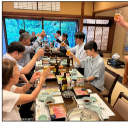
~ 全員で乾杯 ~