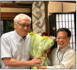
~ 花束贈呈 ~ 所長から下西顧問へ