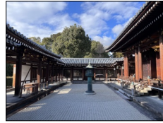
本堂と共に改修した回廊