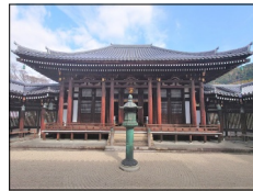
屋根を葺替えた本堂