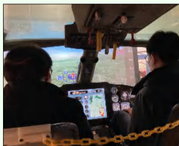
難しい。。。操作をマスターしないと