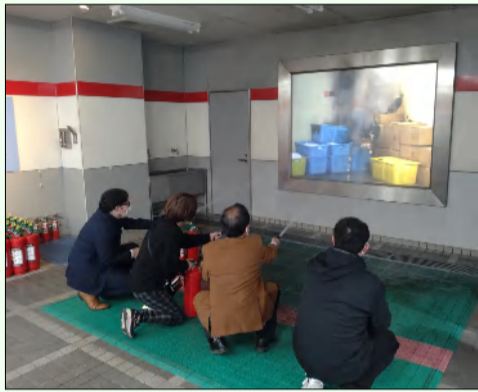
↑ 映像と消火器での消火体験。発見したら大声で『火事だー!』