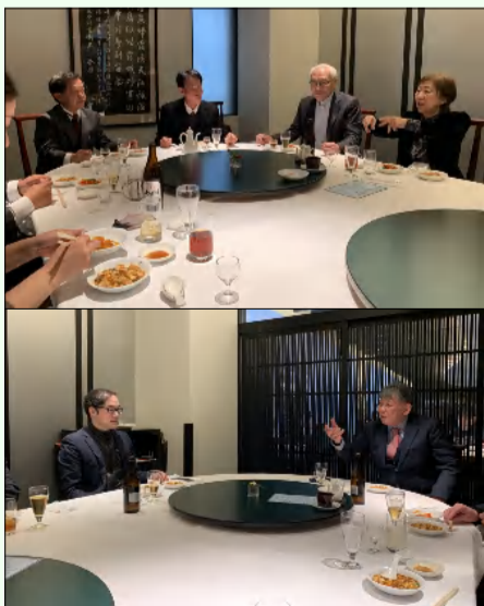
↑ 新年を全員で迎えました。

今年も笑顔で新年を迎えることができました。昨年は多くの方の支えと出会いの中で、多様な建築に携わることができ、今年も所員一同気持ちを引き締めて更に努力を重ねて精進して参ります。