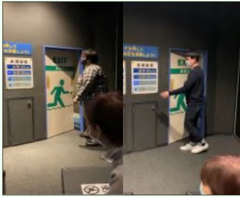
↑ 浸水し水圧のかかった扉の開閉がどれだけ重いかを体験。

京都市市民防災センターは地震等の様々な災害についての体験ができ、市民の防災意識向上を目的とした施設です。平成7年に開設し、現在は近年多発する大型台風や都市型水害に対する内容も追加されており、時代に合わせた防災学習が可能となっています。体験を通して所員の防災意識を向上できたと思います。