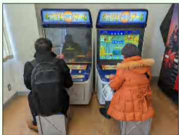
防災にまつわるゲームも楽しみました。