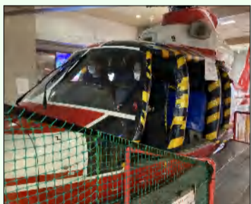
実際に活躍していた救助ヘリ操作を疑似体験