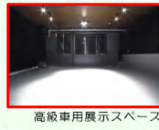
高級車用展示スペース