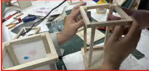
難しい組立作業は二人で協力！