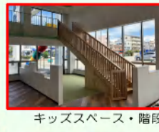
キッズスペース・階段