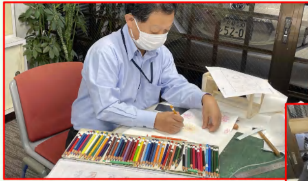
障子紙のデザインを考え、完成を目指す。

冬のレクリエーションとして、所内でオリジナル行燈作りを行いました。事前に準備した作成キットを組み立て、障子紙には所員各々のデザインをあしらひ、個性ある様々な行燈が完成しました。行燈は1月末まで事務所玄関に飾っています。夕方以降はライトアップもしておりますので、お立ち寄りの際は、ぜひご覧ください。