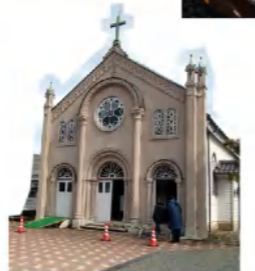
(47)宮津カトリック教会見学