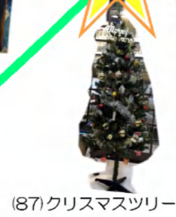
(87)クリスマスツリー