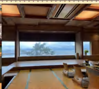
◆ 錦江湾を見ながらの夕食 ◆