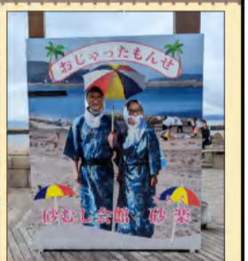
◆ 砂蒸し会館 ◆