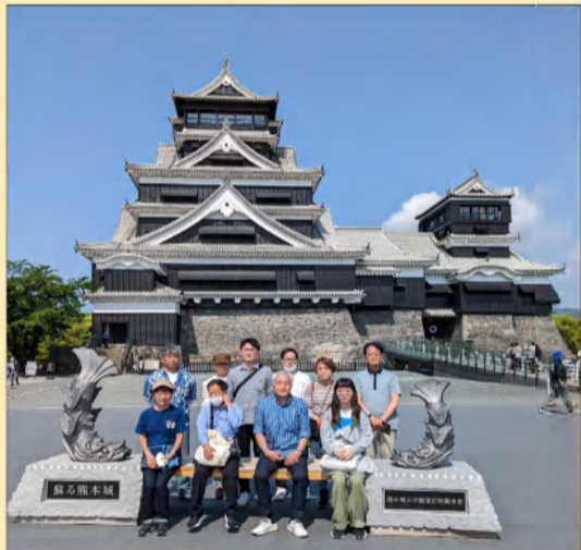
◆ 熊本城 記念撮影 ◆

〇熊本城 加藤清正によって築城された熊本城。本丸が完成した慶長12年に現在の「熊本城」の表記に改め、「銀杏城」の別名でも親しまれてる。平成28年熊本地震では石垣の崩落や建造物の倒壊など、甚大な被害を受けた。令和元年に特別公開がスタートしたが、復旧作業は現在も続いている。