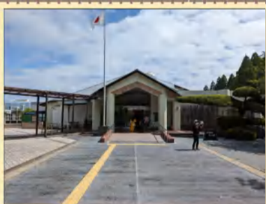
◆ 知覧特攻平和会館 ◆