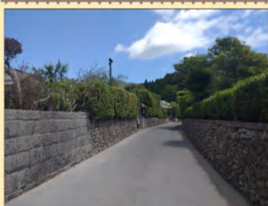
◆ 知覧武家屋敷 ◆