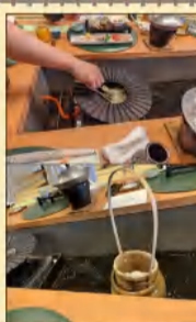
◆ 源泉温泉 たまご ◆