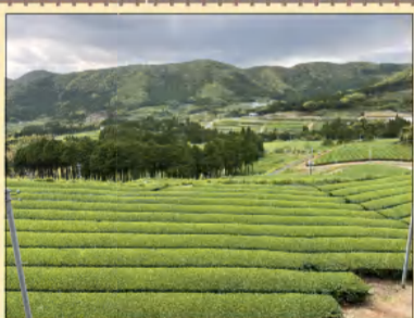
◆ 知覧の茶畑 ◆