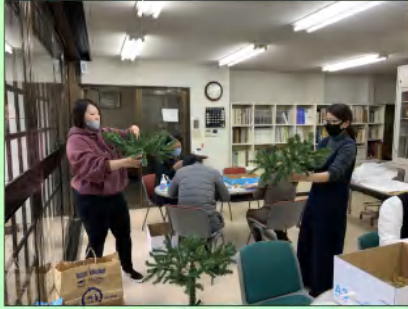
↑ツリーの枝を広げる作業

オーナメントを飾る土台となるクリスマスツリーの高さは一八〇センチの物を用意。7つのパーツに分かれたツリーの枝を広げ組み立てて、枝ぶりのバランスをとるのに意外と時間がかかりました。