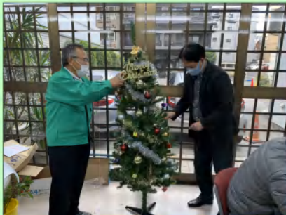
↑まずは基本的な飾り付け

ツリーについては様々な材料を用意し、所員でオリジナルのオーナメントを作成しました。オリジナルの作品も多く揃いました。