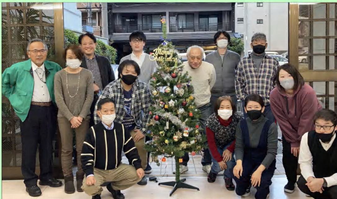
◆オリジナルクリスマスツリーと記念撮影◆

○まとめ 今年には新型コロナウイルスが流行し、その時々に対応した対策が求められた。寒い状況と改め、年末年始も体調管理に気を付け、よい新年を迎えられればと思います。