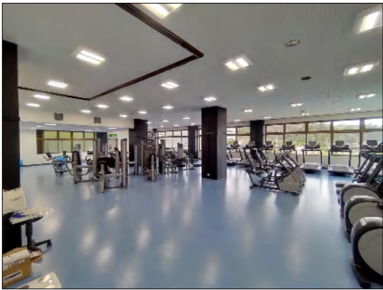
3階 トレーニングジム