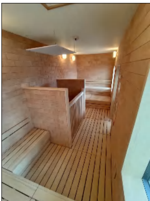
2階 パーテゾーン サウナ