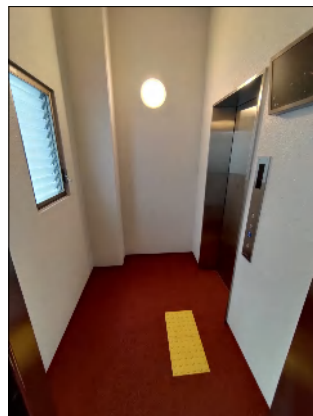
プール・パーテゾーン接続用 エレベーター