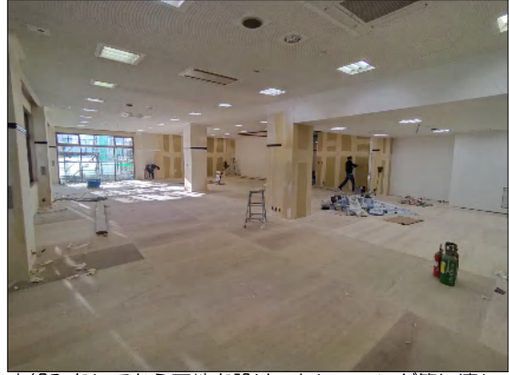
【3階トレーニングジム】