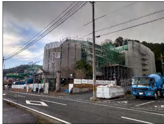
1月現在の外観 外壁吹付の吹替えを行っています。

工事名：クアハウス岩滝改修工事 設計監理：株式会社中村設計 建築工事：株式会社山寅組 設備工事：株式会社山添電気 工期：令和元年7月17日から 令和2年3月31日まで 建物概要：竣工：平成5年10月 鉄筋コンクリート造 3階建て 一部鉄骨鉄筋コンクリート造 延床面積：3,082.76㎡ 建築面積：1,630.46㎡