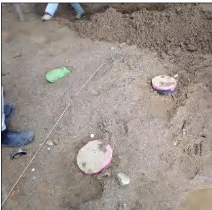
地中に埋まり見えなくなりますが、しっかりと建物を支えてくれます。