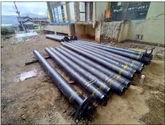
先端に羽が付いており、杭自体で地面を掘っていきます。 12~15mの杭を16本打設しました。