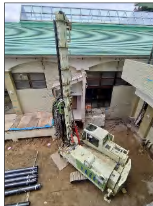
鋼管杭専用の杭打機です。