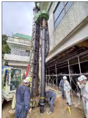
杭が長いので途中で継いでいきます。