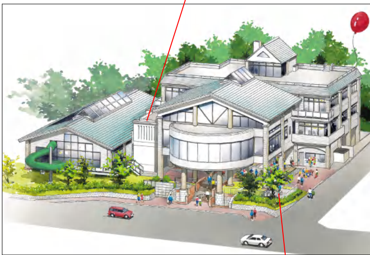
リニューアル後のイメージ図です。飛び鳥の目から見たように見えるという意味から鳥瞰(ちょうかん)パースといひます。

プールとバーテゾーンをつなぐ階段を撤去しより安心して利用していただけるよう新しい緩やかな階段とエレベーターを新設します！