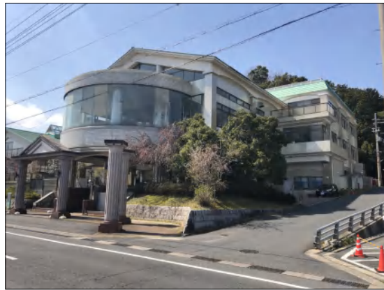
7月末をもって工事のために一時休館となりました。

この度、工事監理を(株)中村設計、建築工事を(株)山寅組、設備工事を(株)山添電気にてクアハウス岩滝改修工事を進めさせていただくこととなりました。 工事期間中は地元の皆様には何かとご迷惑をおかけしますが、安全と環境に配慮し工事を進めて参りますので、どうぞよろしくお願いたします。