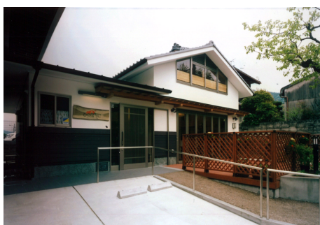
同和園日野デイサービスセンター S造 地上2階建 / 京都市