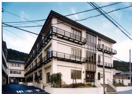
岩倉病院 北館 S造 地下1階地上3階建 / 京都市