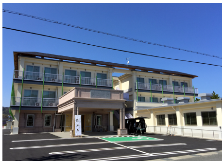
香南会 特別養護老人ホーム 安寿の里 S造 地上3階建 / 宮崎市