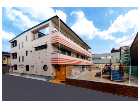
西大路保育園 S造 地上3階建 / 京都市