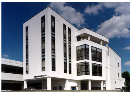
三島救急救命センター管理部門 S造 地上4階建 / 高槻市