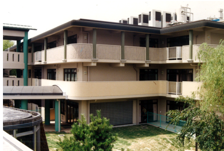
京都老人ホーム 特養棟 RC造 地下1階地上3階建 / 京都市