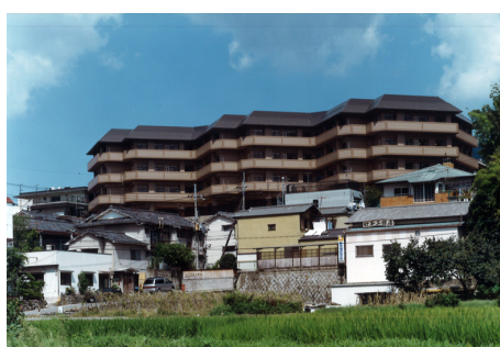
同和園 壱番館 RC造 地下1階地上3階建 / 京都市