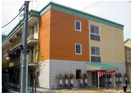
アンドライフサービス(株) グループホーム S造 地上3階建 / 大阪府堺市