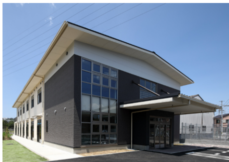
ディアレスト障害者通所施設 S造 地上2階建 / 京都府八幡市