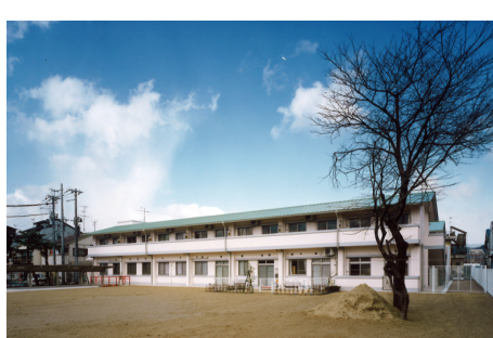
本願寺ウスタリアガーデン RC造 地上2階建 / 京都市