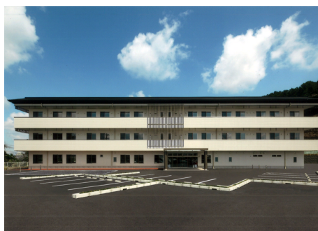
水口病院 介護老人保健施設 S造 地上4階建 / 滋賀県甲賀市