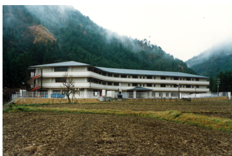
老人保健施設 しずはうす RC造 地上3階建 / 京都市