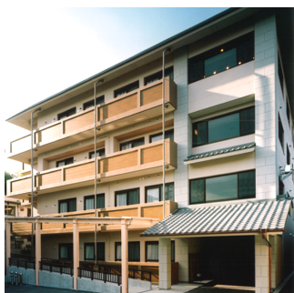
同和園 弐番館 RC造 地下1階地上5階建 / 京都市