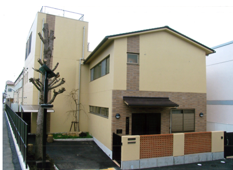
更生保護施設 本願寺白光荘 RC造 地上2階建 / 京都市