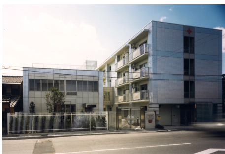
京都第二赤十字病院 看護婦寮 RC造 地下1階地上4階建 / 京都市