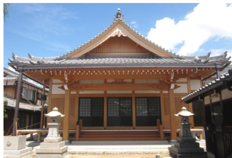
浄安寺 本堂 再建 木造 平屋建 / 滋賀県草津市