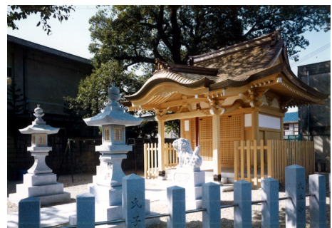
高見神社 木造 平屋建 / 大阪府松原市