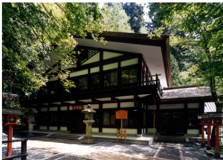
鞍馬寺 普明殿 S造 地上2階建 / 京都市