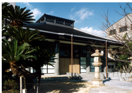
妙善寺 本堂・客殿 S造 平屋建 / 神戸市