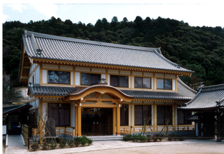
永観堂 禅林寺 聖峯閣 RC造 地上2階建 / 京都市