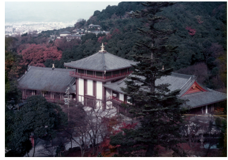
北法相宗 清水寺 大講堂 SRC造 地下2階地上3階建 / 京都市