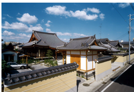
末慶寺 伽藍 RC造 地上2階建他 / 京都市