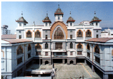
本願寺 神戸別院 RC造 地下2階地上5階建 / 神戸市