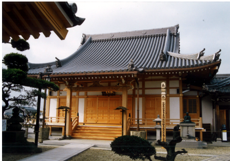
浄土宗 教安寺 本堂・山門 木造 平屋建 / 奈良県磯城郡