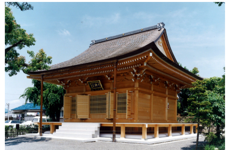
日蓮宗 善正寺 釈迦堂 木造 平屋建 / 京都市