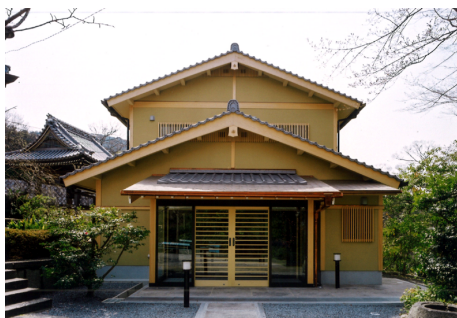
靈山興正寺別院 寺務所 木造 地上2階建 / 京都市