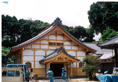
大頂寺 客殿 木造 地上2階建 / 宮津市