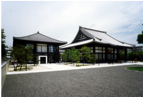
曹洞宗 崇禅寺 本堂・客殿 S造 地上2階建 / 大阪市