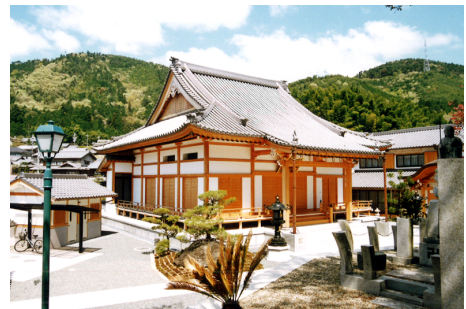
単立正覚寺 伽藍 RC・木造 平屋建他 / 京都府綴喜郡