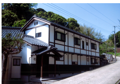
妙照寺 庫裡 木造 地上2階建 / 宮津市