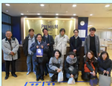
→ お土産も買って記念撮影。