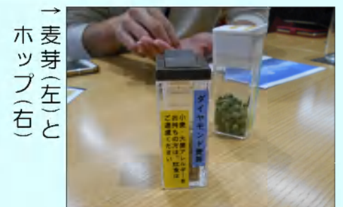
→ 麦芽(左)とホップ(右)

→ 到着！ ★講座 こだわりのビールづくりでの水について学び、原材料の麦芽の試食、ホップの香りを体験。製造工程では、各分野のプロの仕事学びました。 ザ・プレミアム・モルツの「神泡」のみを試飲し、なめらかな泡に感動しました。