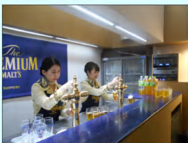
→ ビールマイスターが注いでくれます。

工場見学後はお待ちかねの試飲！講座と工場見学を踏まえて飲むビールはどんな味がするのか・・・