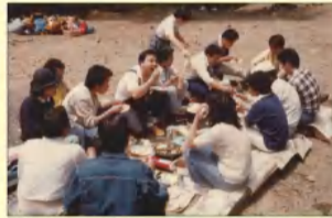
↑昭和54年バーベキュー 現在も続く定番のレクリエーションです。所員の親睦を深め、リフレッシュにもなっています。