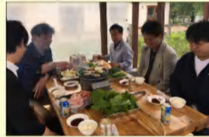
↑平成30年バーベキュー