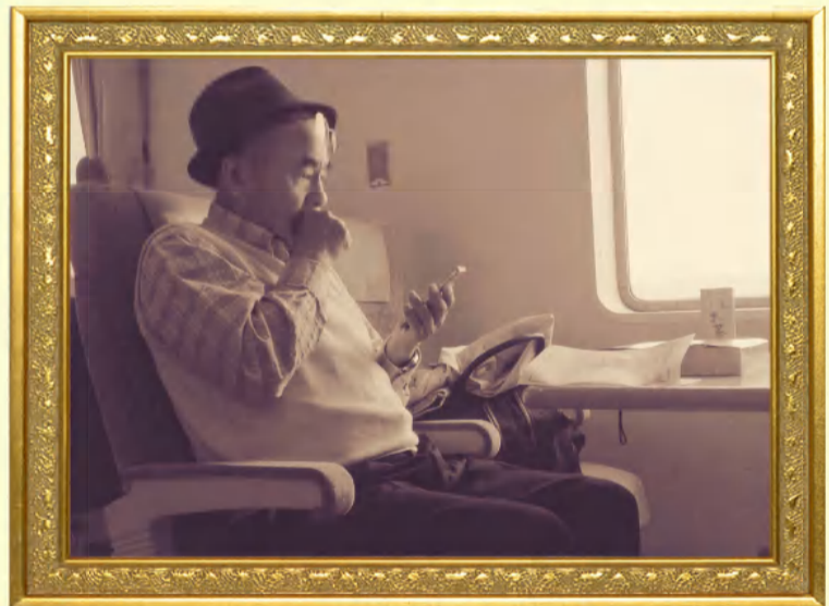
フリー部門 第一位 「何か家に忘れてきてる気が・・・」

第七十一号 十一月十七日(土)曇り 今月は所内研修として研修旅行で実施した中村設計写真コンテストの結果発表を行いました！