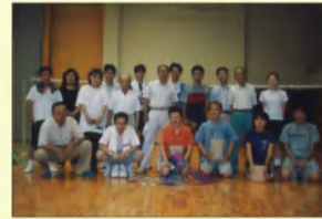
↑バドミントン、ソフトボール、バレーボールなどスポーツも行ってきました。