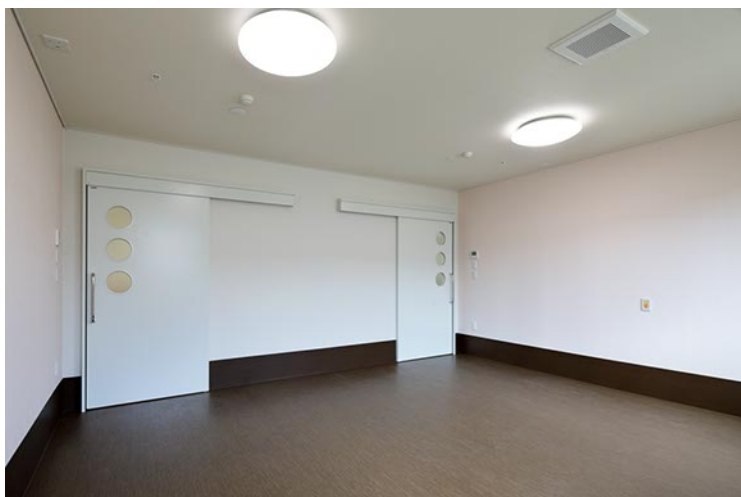
2階ショートステイ室