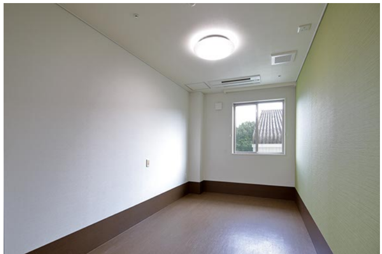
2階ショートステイ室