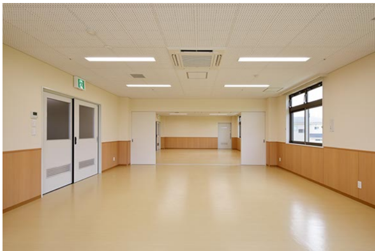
2階多目的室・会議室