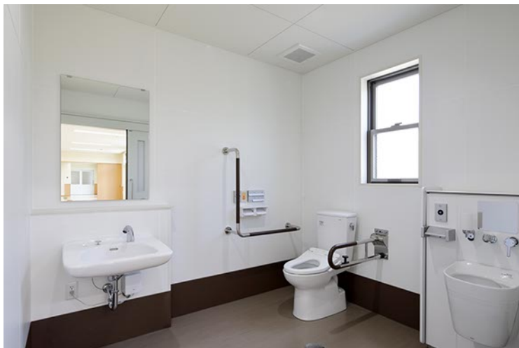
1階車椅子用トイレ