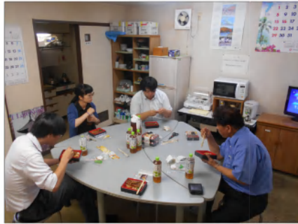
▲あーおいしすぎる・・・